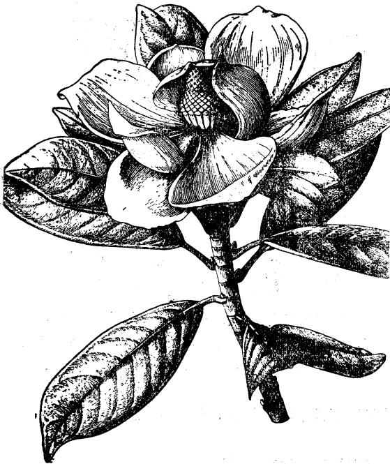
图7 荷花玉兰 Magnolia grandiflora Linn. 花枝

常绿乔木,在原产地高达30米;树皮淡褐色或灰色,薄鳞片状;小枝、叶背、叶柄密被褐色短绒毛,幼树叶背无毛。叶片厚革质,椭圆形、长圆状椭圆形或倒卵状椭圆形,长10—20厘米,宽4—10厘米,先端钝或短钝尖,基部楔形,叶面深绿色,有光泽;侧脉每边8—9条;叶柄长1.5—4厘米,无托叶痕。花白色,芳香,直径15—20厘米,花被片9—12,厚肉质,倒卵形,长7—9厘米,宽5—7厘米;雄蕊长约2厘米,花丝扁平,紫色,花药内向,药隔伸出成短尖;雌蕊群椭圆形,密被长绒毛,心皮卵形,长1—1.5厘米;花柱卷曲。聚合果圆柱状长圆形或卵形,长7—10厘米,直径4—5厘米,密被褐色或淡灰黄色绒毛;蓇葖背面圆,顶端具长喙;种子椭圆形或卵形,侧扁,长约14毫米,宽约6毫米。花期:5—6月;果熟期:10月。