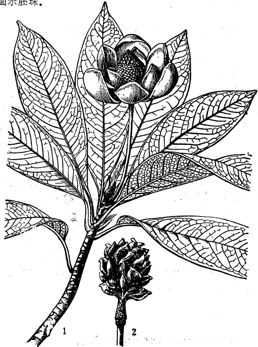
图3 仁昌木莲 Manglietia chingii Dandy

1.花枝；2.苞片；3.外轮花被片；4.中轮花被片；5.内轮花被片；6.雄蕊和雌蕊群；7.雄蕊腹面；8.雌蕊；9.雌蕊纵切面示胚珠。